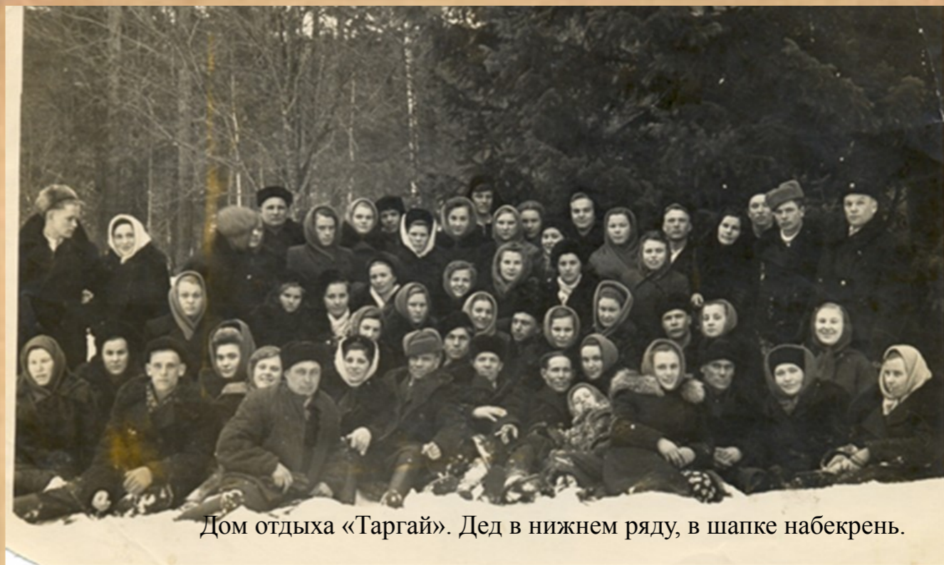
Дом отдыха «Таргай». Дед в нижнем ряду, в шапке набекрень.